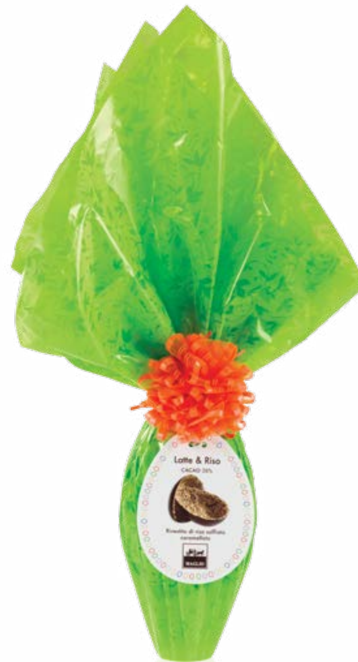
Uovo Cioccolato Latte 38% & Riso Incarto Verde / 200g - Imballo 3 pz Milk Chocolate with Rice Green Wrapper / 200g - Pack 3 pcs cod.300704